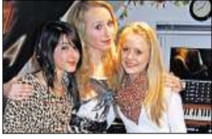
Beteiligten sich am Projekt »Creative Talent«: Husumer Schüler der Musikschule »Workshop Musik«.