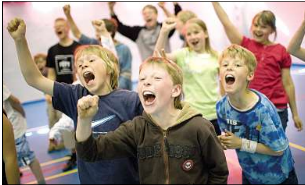
Selbstbewusste Körpersprache, gezielte Worte, schnelle Hilfe - wie sich Kinder wehren können, lernen sie beim Sicherheitstraining.

von 11 bis 17 Uhr halt. Zweck der vom Felsenweg-Institut der Karl Kübel Stiftung für Kind und Familie (Bereich Family Games) in Zusammenarbeit mit dem Kosmos-Spieleverlag initiierten Aktion ist es, die Lust am gemeinsamen Spielen in der von moderner Unterhaltungselektronik geprägten Zeit zu stärken.