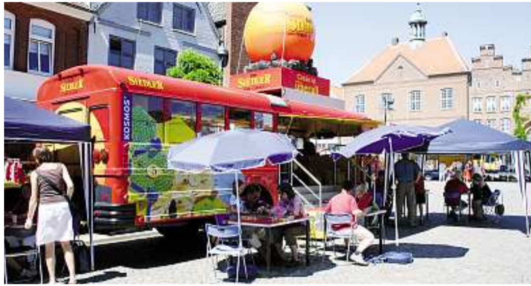
Das Spielmobil macht am 11. August Halt in der Husumer Innenstadt.